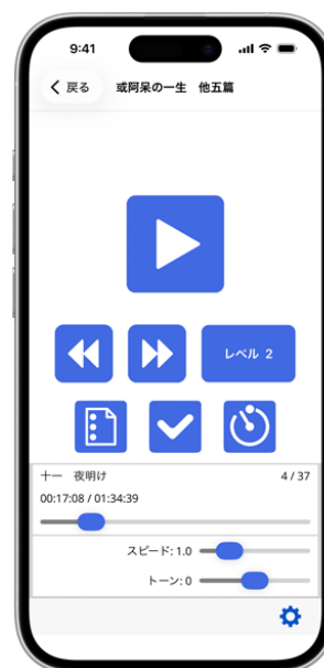
プレクストークリーダーの再生画面