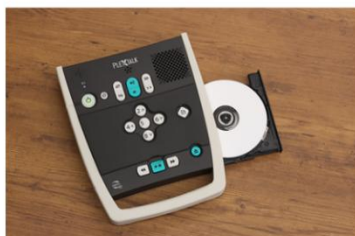
デジターCDから内蔵メモリにバックアップ